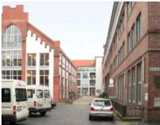
Das Ahrberg-Viertel heute

Die Deisterstrasse, einst die Einkaufs- und Verbindungsstraße zwischen Linden-Süd und Linden-Mitte, hat in den letzten Jahren unter der geringen Kaufkraft stark gelitten. Seit Ende 2005 versucht die Stadt Hannover mit der Ansiedlung von individuellen Mode-Geschäften der Straße ein neues Profil zu geben und eine eigene Subkultur zu etablieren, die von dem mediterranen Lebensgefühl in Linden-Süd profitieren soll.