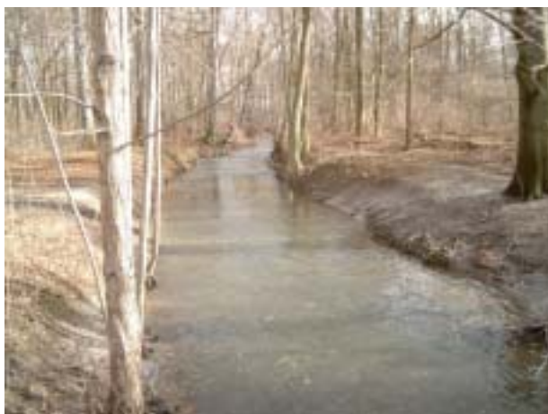
Die Ihme an Hannovers Südgrenze

Nachdem der Fluss sowohl das Ihmezentrum, als auch das Lindener Heizkraftwerk passiert, mündet die Ihme schließlich am so genannten „Leinedreieck“, das auch gleichzeitig das Dreieck zwischen Linden-Nord, der Calenberger Neustadt und der Nordstadt bildet, schließlich in der Leine.