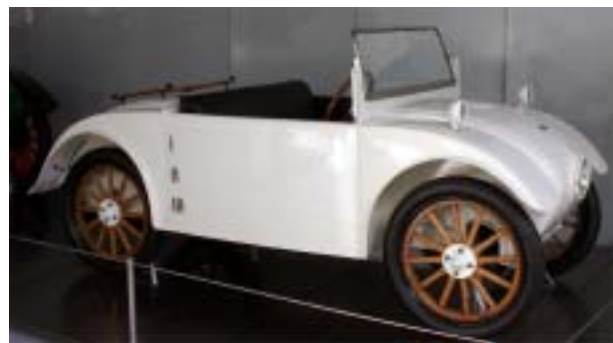
Das Hanomag „Kommissbrot“