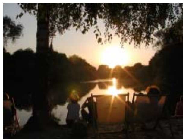
Die Ihme fließt in die Leine