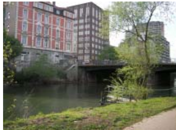
Ihme-Ufer, Blick auf die Lindener Uferseite